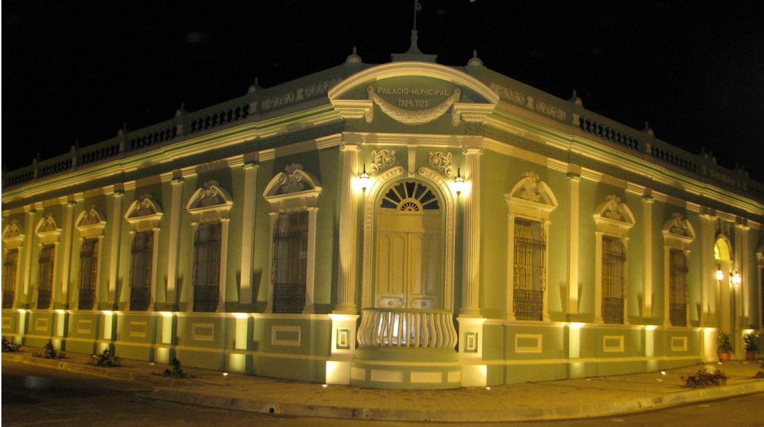
Figura 3: Palacio Municipal de Santa Tecla.