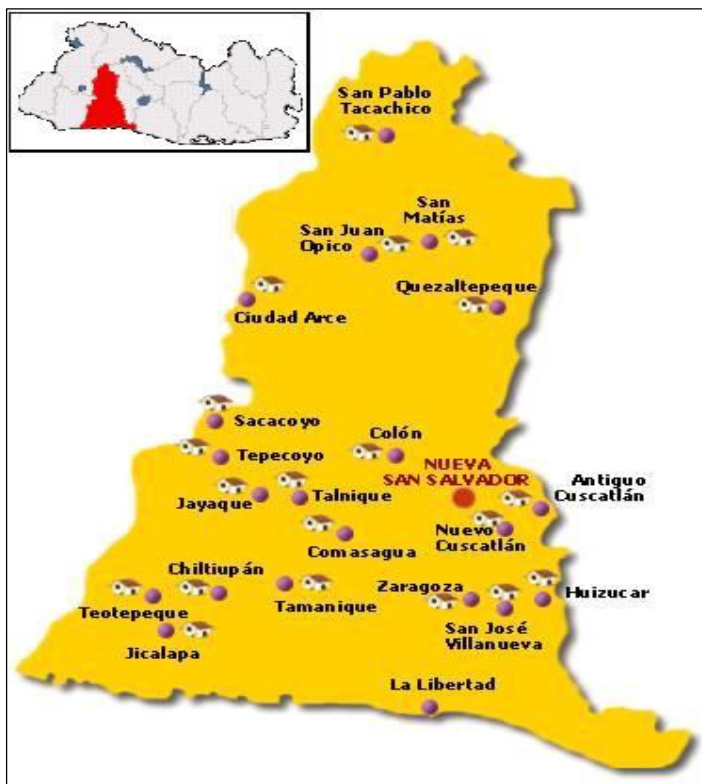
Figura 6: Mapa del Departamento de La Libertad.