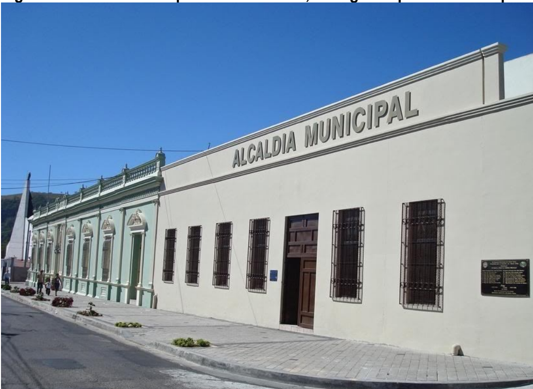
Figura 4: Alcaldía Municipal de Santa Tecla, contiguo al palacio municipal.