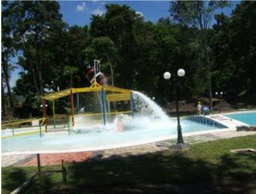
Figura 5: Centros recreativo el cafetalón de la ciudad de Santa Tecla.