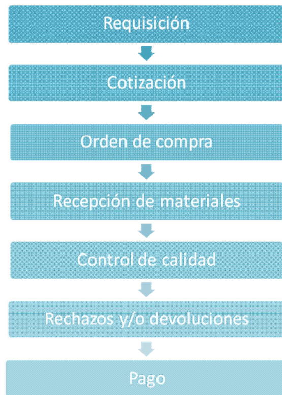
Gráfico 1: Proceso de compra

En el gráfico anterior se describe el proceso de compras que inicia con la fase de la requisición, que no es más que el pedido efectuado al proveedor para satisfacer la demanda de compra, posteriormente el proveedor envía cotización donde especifica la cantidad a pagar, forma y plazo de pago. Con la información anterior se procesa la orden de compra, para proceder a la recepción de materiales, realizando un control de calidad a los productos o mercancías recibidas; en el caso que estos no cumplan con las condiciones establecidas en la orden de compra se realizara la devolución o rechazo. Una vez aceptado el pedido se procede al pago del mismo.